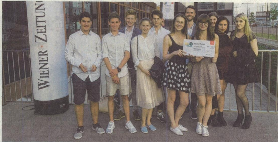
Schülerinnen und Schüler der 6. und 7. Klasse schlossen sich zu einem Filmteam zusammen und wurden mit ihrem Filmbeitrag erfolgreich. Er gefiel der Redaktionsjury der am besten.

Die Redaktion der „Wiener Zeitung“ hatte all jene Beiträge, die aufgrund eines YouTube-Votings nicht unter die Top-10 gekommen sind, noch einmal durchgesehen. Sie fand dabei noch Preiswürdiges und prämierte schließlich den Beitrag des Abteigymnasiums Seckau, der im Rahmen des Wahlpflichtfachs „Die Macht der Medi-